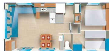
Cottage 2 chambres 30m 2

Les barrières ferment du 08/07 au 20/08 de 22h à 8h.