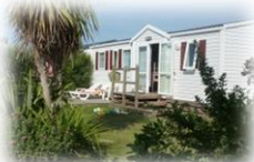
Cottage 3 chambres